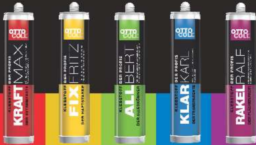
DER EXTREMFESTE DER HAFTSTARKE DER ALLESKÖNNER DER TRANSPARENTE DER FLÄCHENPROFI